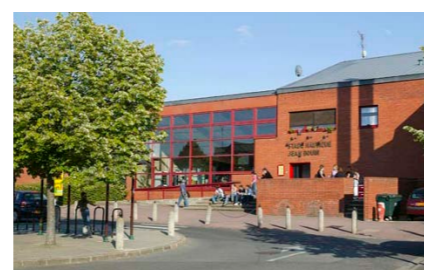
Le stade nautique