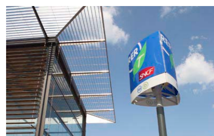
La gare RER de "Savigny-le-Temple - Nandy"

Le bus 33, à proximité immédiate, permet de rejoindre l'Espace Prévert, son cinéma et sa médiathèque en 10 min*. La gare du RER D "Savigny-le-Temple - Nandy" et le centre-ville en seulement 15 min*.