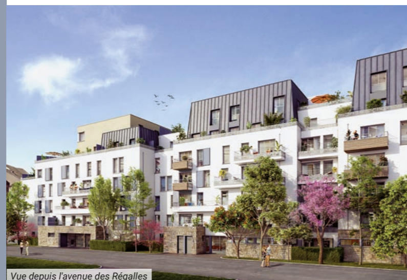
Vue depuis l'avenue des Régalles