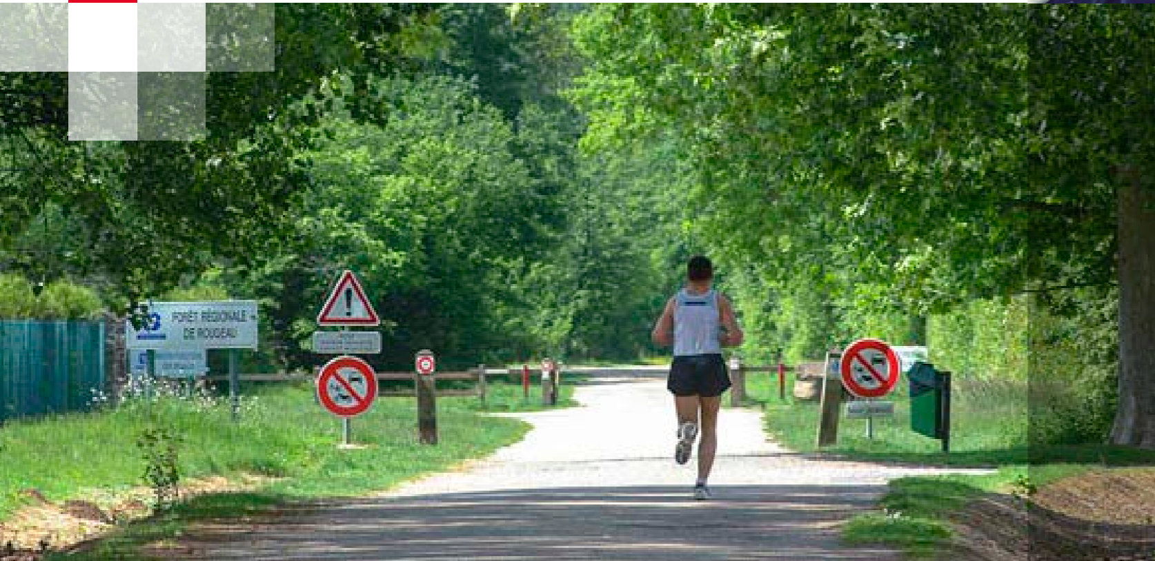
La forêt de Rougeau